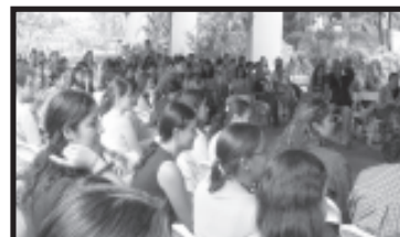
Congreso realizado en Liberia, Costa Rica.

La UBL participó activamente en la organización del congreso en Costa Rica y en la publicación de un libro que saldrá el próximo año. En esa actividad asistieron 560 congresistas provenientes de 26 países.