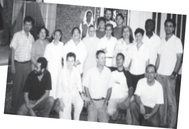
Participantes, Curso en Medellín