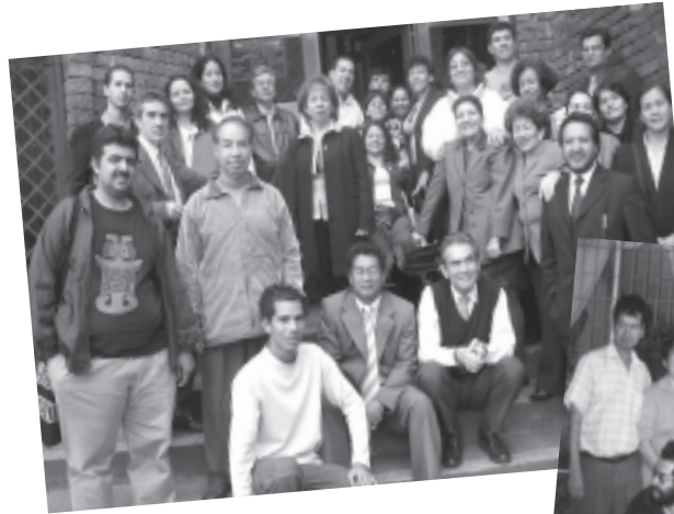
Participantes, Curso en Bogotá