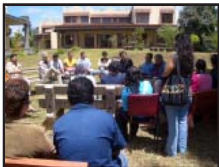
Liturgia de apertura, año lectivo 2008.